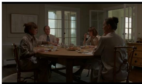
Fotograma de Carlo DiPalma

Família WASP em Interiores e Hannah e suas irmãs