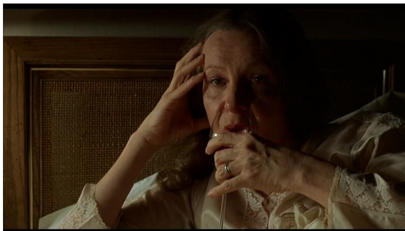
Eve (Geraldine Page)

Eve ao retornar do hospital, após a primeira tentativa de suicídio, assiste a um pregador na TV. Há no rosto um ar de indulgência, que é completado com uma taça de vinho. Um televangelista dialoga com um judeu convertido ao cristianismo, cujo conteúdo da conversa é: