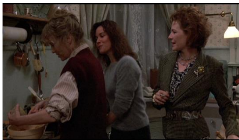
Fotograma de Gordon Willis

Família WASP em Interiores e Hannah e suas irmãs