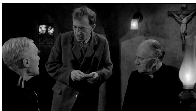
Fotograma de Carlo DiPalma – Neblina e sombras

Portanto, a poesia cinematográfica de Allen é uma manifestação contínua de combate ao esquecimento dos horrores cometidos pelos nazistas contra os judeus, durante a Segunda Guerra Mundial, mesmo que o caráter humorístico possa causar incômodos. Um exemplo está em Desconstruindo Harry , quando a personagem interpretada por Allen, um antissemita judeu, ao negar o Holocausto frisa que “não foram seis milhões de mortos, mas que os recordes são feitos para serem batidos”. Assim, mesmo que Allen renda, ao seu modo, homenagens aos judeus mortos, porém, suas memórias não foram escritas com o sangue dos parentes e amigos mortos.