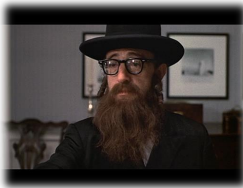
Alvy Singer (Woody Allen) em noivo neurótico, noiva nervosa (Annie Hall) – fotografamas de Gordon Willis