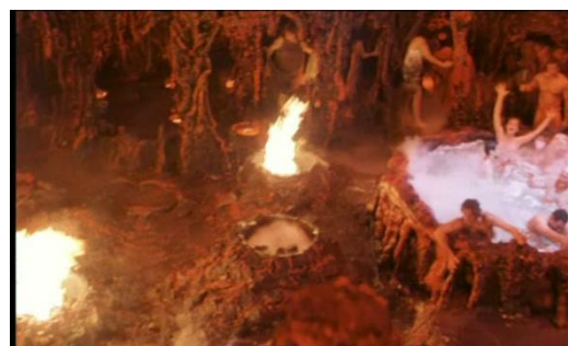
O inferno em Desconstruindo Harry – fotogramas de Carlo DiPalma