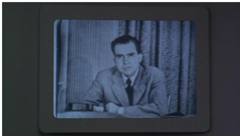
Richard Nixon