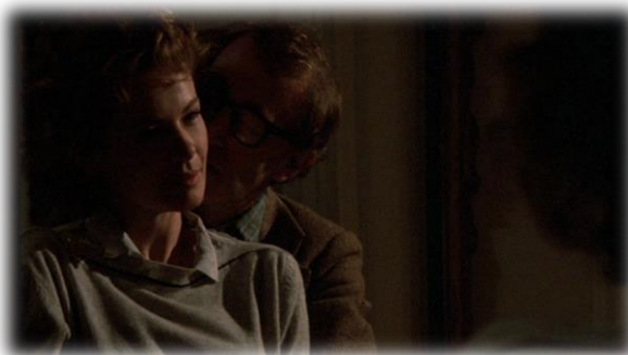
Mickey (Woody Allen) – Personagens de Woody Allen, o judeu no ambiente WASP

Holly e Lee, diferentemente de Hannah, ainda não se encontraram na vida. Holly, após várias tentativas frustradas que vão de sócia de um buffet a cantora, finalmente consegue escrever um livro. Lee vive com Frederick (Max Von Sydow) 17 , artista plástico